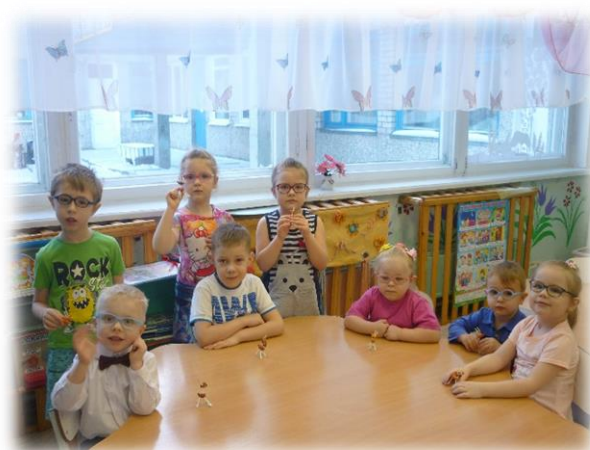
-Лепка ( смешивание пластилина разных цветов) «Каменный цветок», колечки с уральскими самоцветами