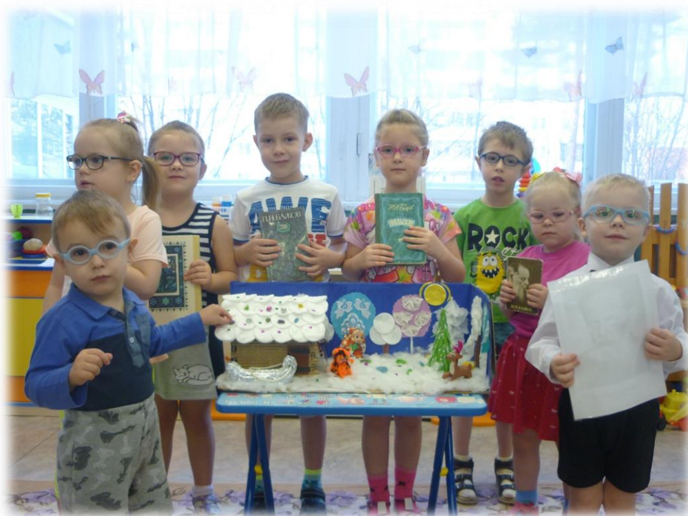
-Выставка изделий из уральских самоцветов « В гостях у Хозяйки Медной горы»