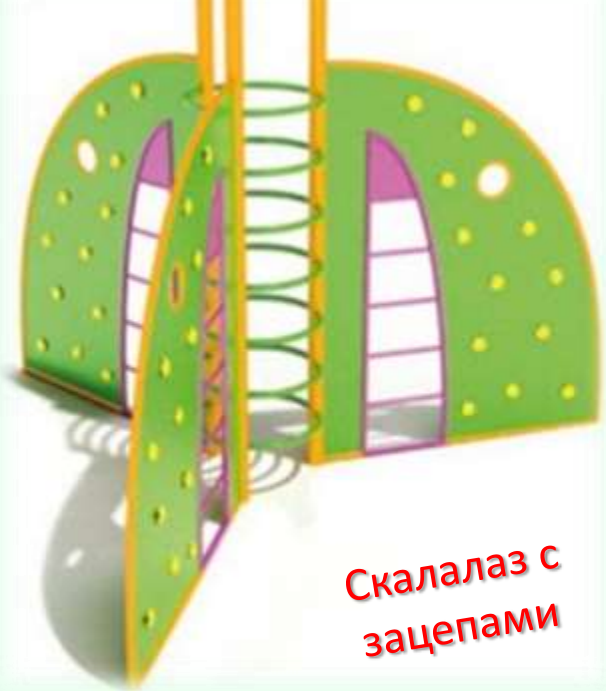
Скалалаз с зацепами