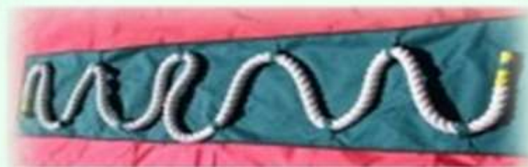
Массажная дорожка «Змейка»