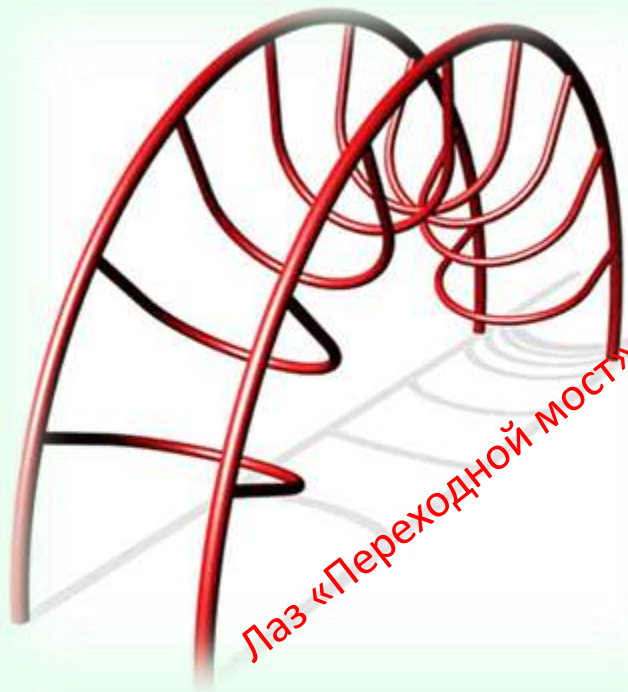
Лаз «Переходной мост»