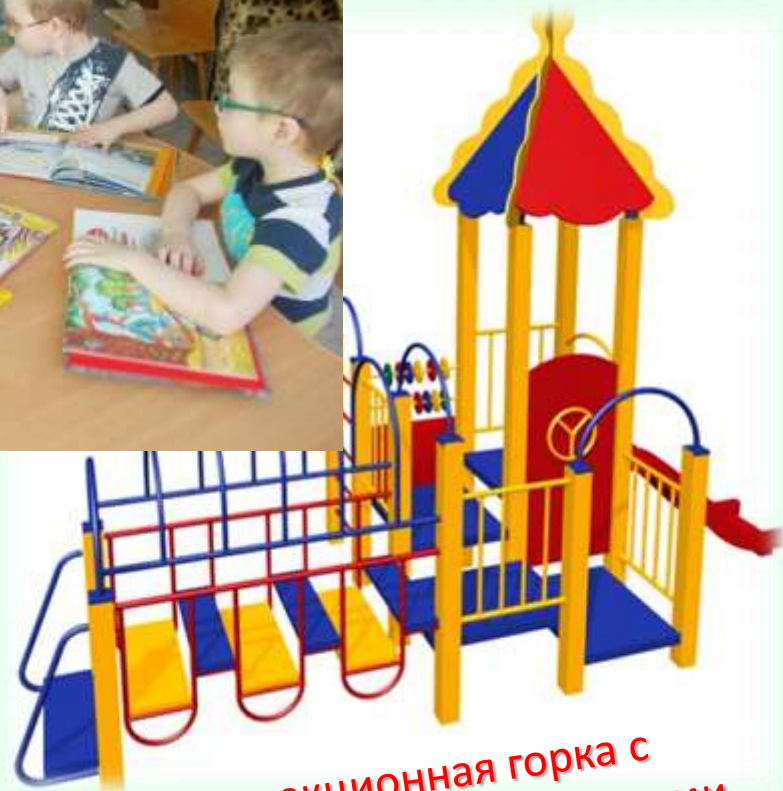
Коррекционная горка с дополнительными поручнями