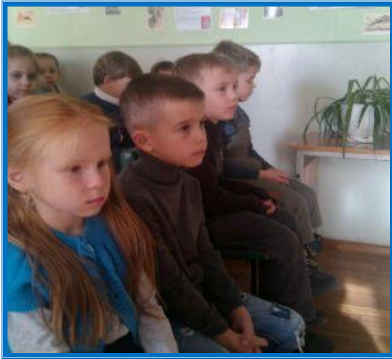
« Азбука финансов»