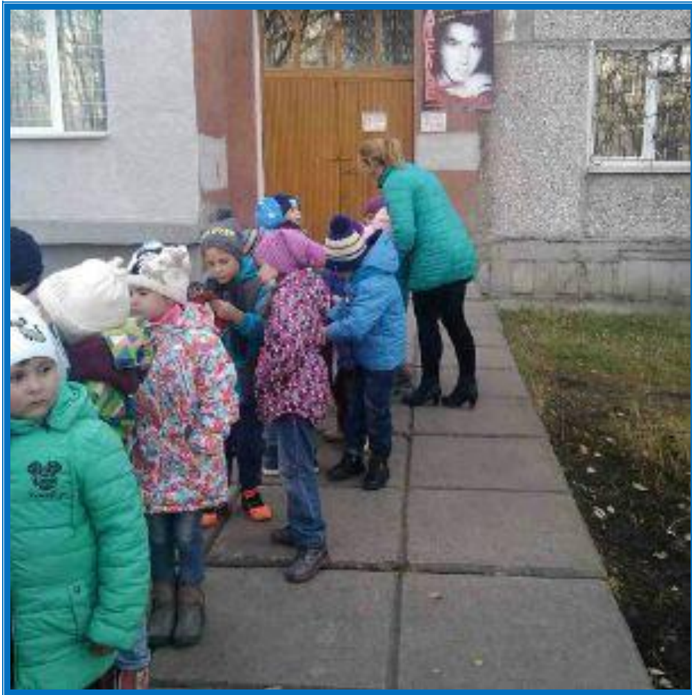
«Посещение библиотеки №8»