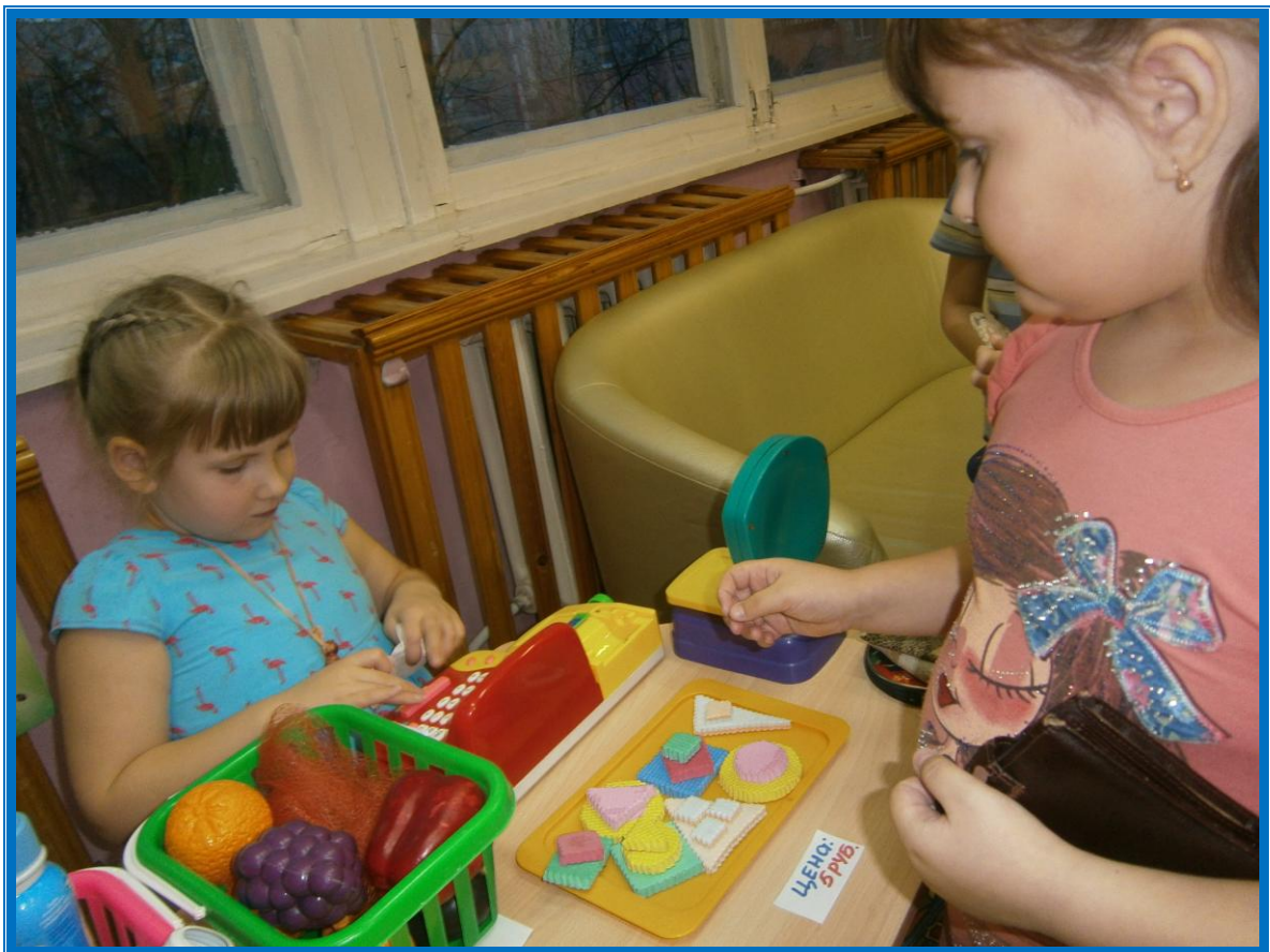
Обыгрывание в сюжетно-ролевых играх