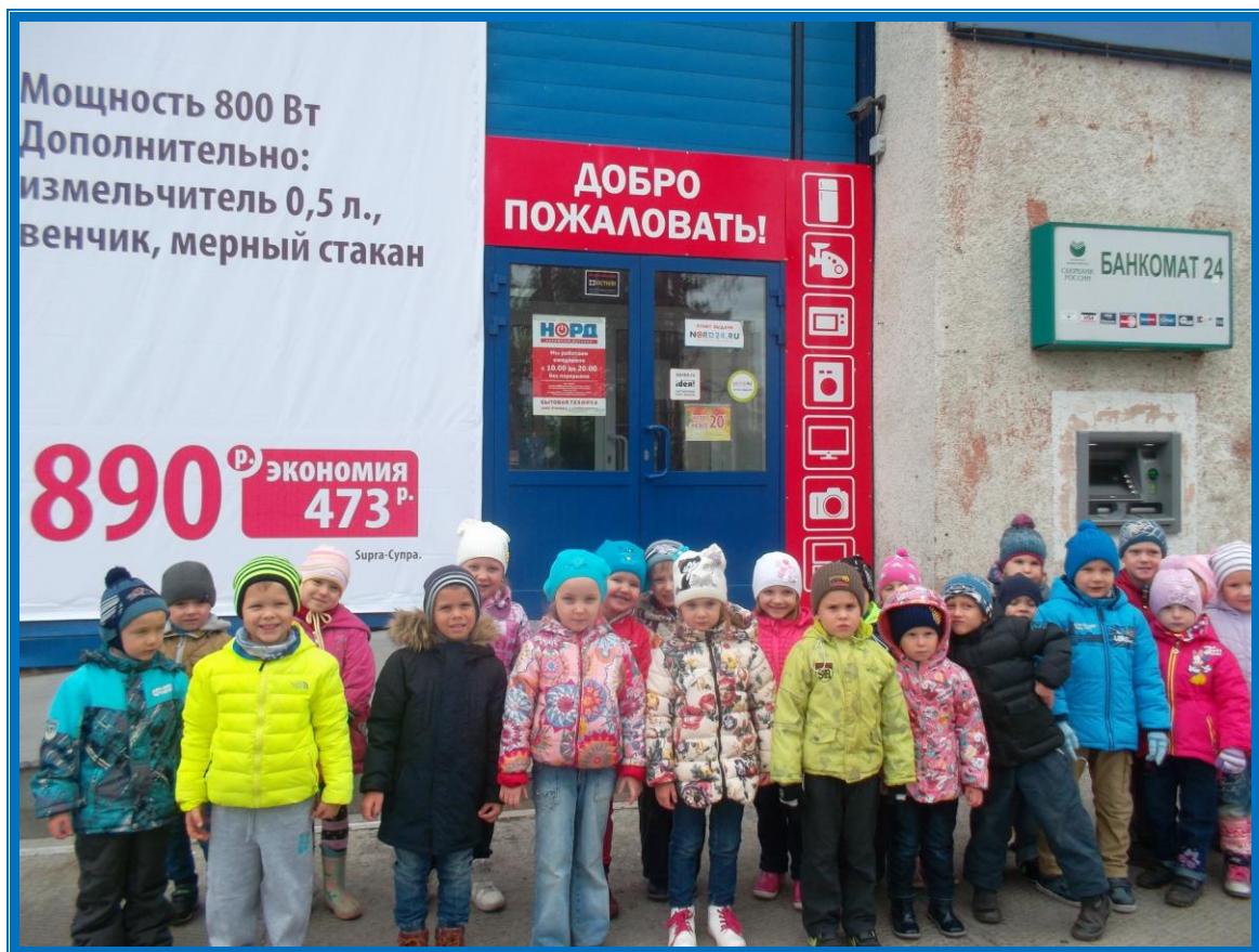
Экскурсия в магазин «НОРД»