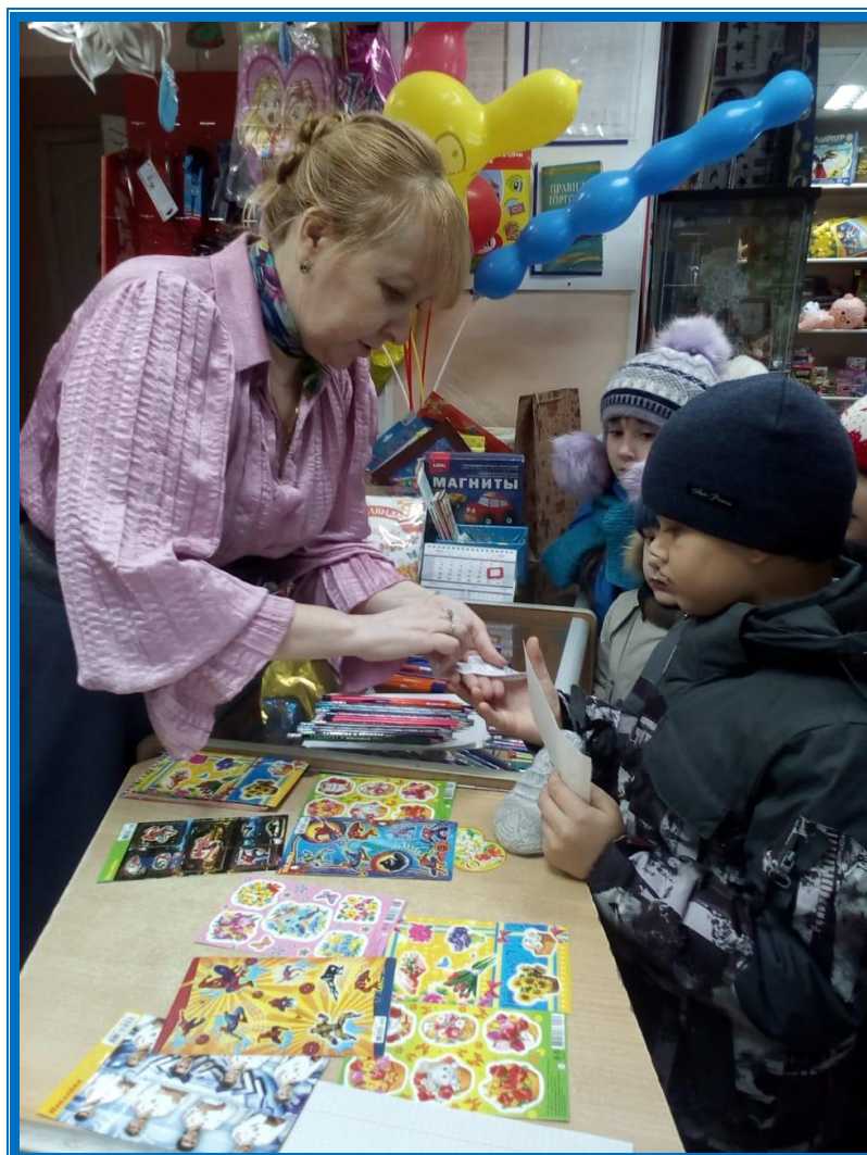
Экскурсия в книжный магазин. Каждый ребенок делает покупку к школе.