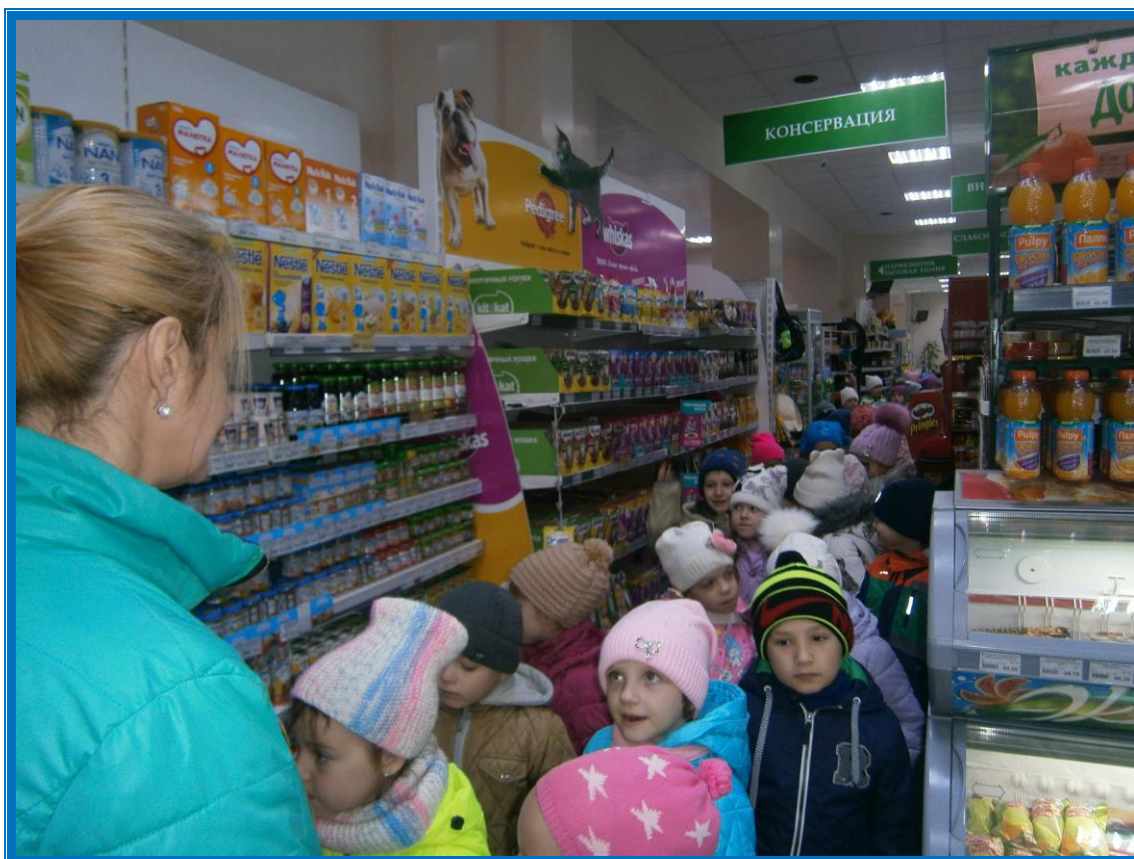
Экскурсия в Супермаркет «Выбор»